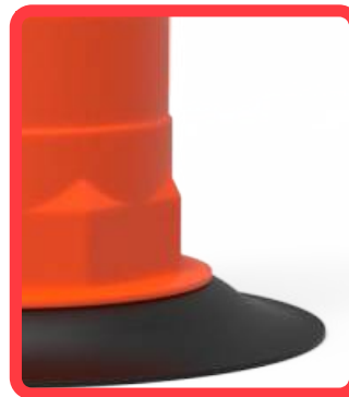
Base de caucho