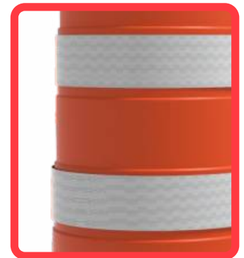
Anillos de reflejante