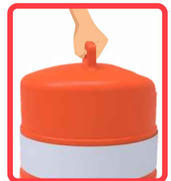
Manija para manipular