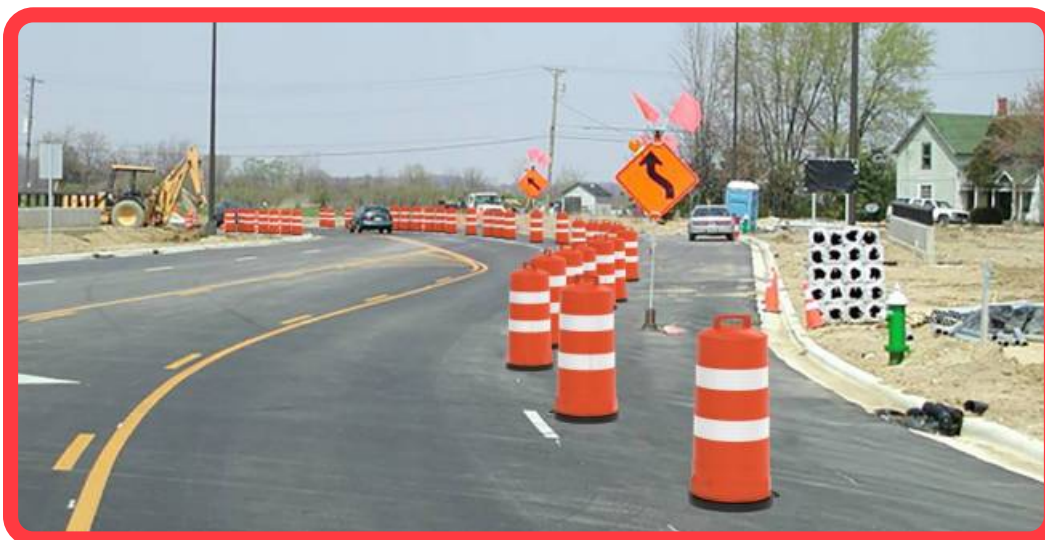
Las imagenes son ilustrativas