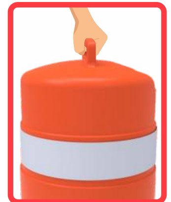
Manija para manipular