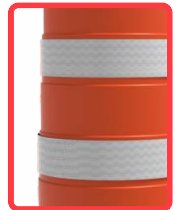
Anillos de reflejante