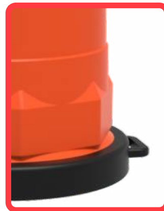
Base con mango para ser manipulado