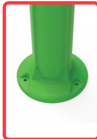
Cartabones y barrenos