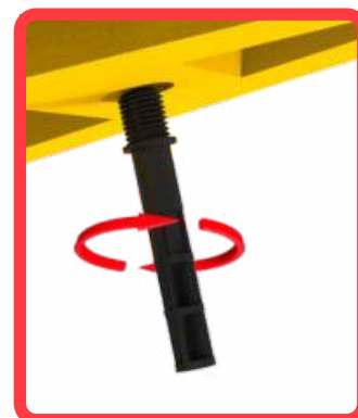
Colocación de pernos