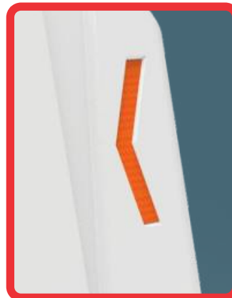
CHEVRONES GRABADOS EN EL CUERPO