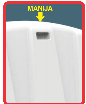
MANIJA PARA PODER MANIPULAR