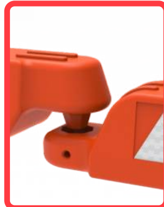
Ensamble "macho- hembra"