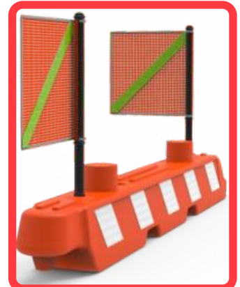
Barreno para 1 o 2 banderolas