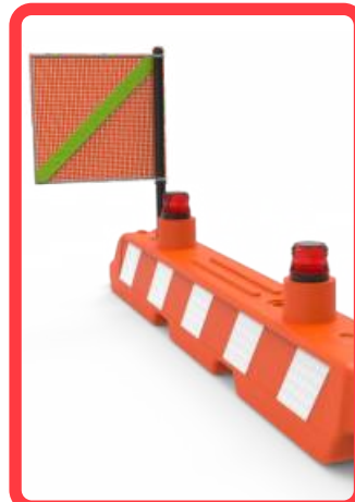
Torreta y banderola