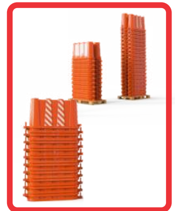
ALMACENAJE HASTA 75 PZS POR TARIMA