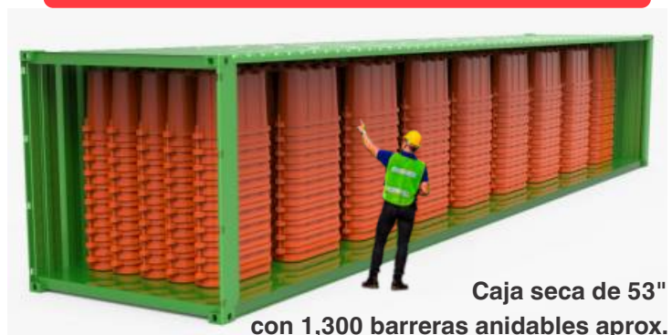
Caja seca de 53" con 1,300 barreras anidables aprox. Canalizando 1950 mts. lineales