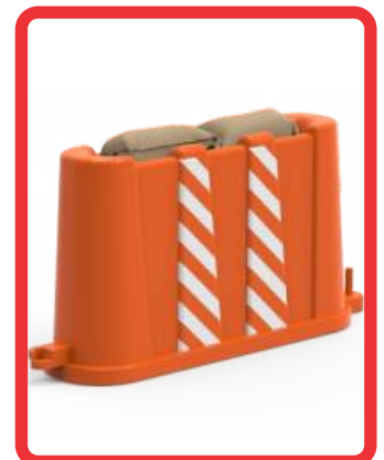
2 COSTALES DE ARENA OPCIONALES DE 10.00 KG C/U