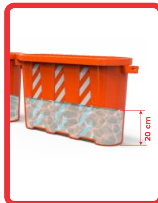
LLENADO CON AGUA HASTA 20 cm MÁXIMO