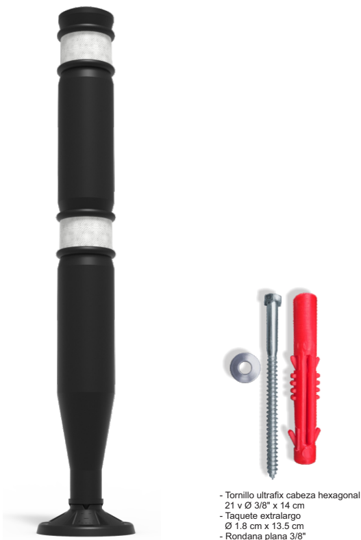
- Tornillo ultrafix cabeza hexagonal 21 v Ø 3/8" x 14 cm - Taquete extralargo Ø 1.8 cm x 13.5 cm - Rondana plana 3/8"

Sugerido principalmente para impedir que los vehículos invadan zonas prohibidas o de peligro.